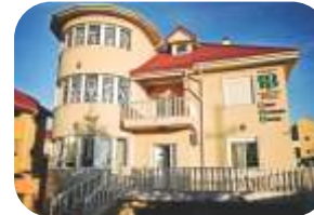
ISB Early Learning Centre www.isb.ro/early-learning-centre