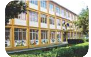
Scoala Spectrum Constanta www.constant.spectrum.ro