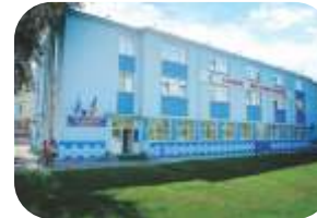
Liceul International de Informatica Constanta www.ichc.ro