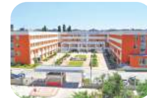
Universitatea Europei de Sud-Est Lumina www.lumina.org