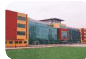
The International School of Bucharest www.isb.ro