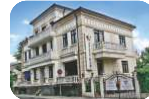
Scoala Internationala Spectrum, Iasi www.iasi.spectrum.ro