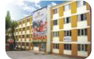
Scoala Spectrum Bucuresti www.bucuresti.spectrum.ro