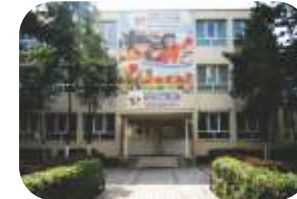
Scoala Internationala Spectrum, Ploiesti www.ploiesti.spectrum.ro