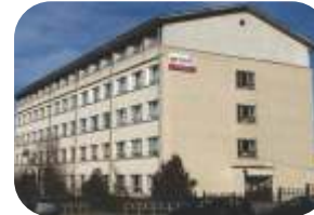
Scoala Internationala Spectrum, Cluj www.cluj.spectrum.ro