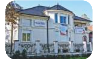
Scoala Internationala Spectrum, Timisoara www.timisoara.spectrum.ro