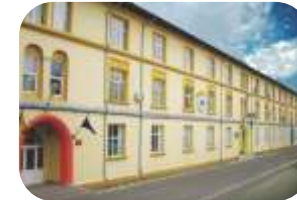
Liceul International de Informatica Bucuresti www.ichb.ro