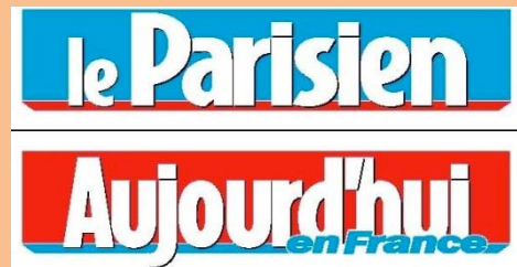
Logo Aujourd'hui en France et Le Parisien

Aujourd'hui en France représente l'édition nationale du quotidien Le Parisien , le dernier ayant aussi dix éditions départementales en Île- de-France. Ensemble, ce sont les quotidiens les plus achetés par les Parisiens et les Français. C'est un quotidien national populaire, ne manifestant aucun favoritisme.