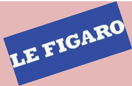
Logo du quotidien Le Figaro

Le Figaro est le plus ancien quotidien français encore vendu, paraissant depuis 1826. Il a pris le nom du personnage de Beaumarchais, la réplique de celui-ci « Sans la liberté de blâmer, il n'est point d'éloge flatteur » étant d'ailleurs mise en exergue sur la une. Le Figaro a une ligne éditoriale de droite conservatrice.